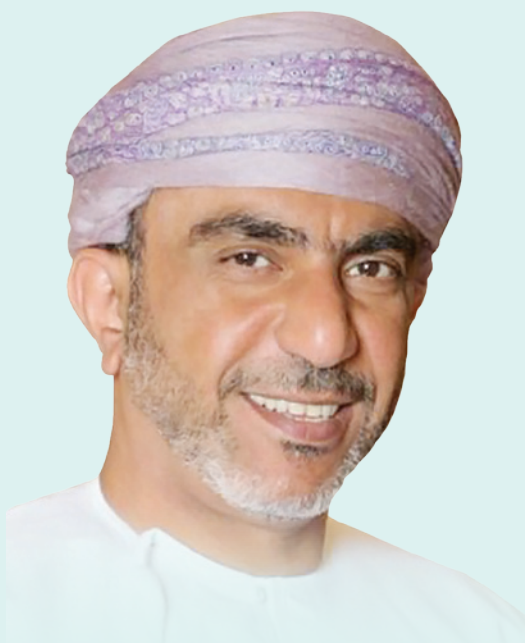
سالم بن سعيد بن سالم الوهيبي رئيس الاتحاد العُماني لكرة القدم

ما أجمل أن يُقام السوبر العُماني بين أحضان عراققة الرستاق الخالدة ، مُطلدًا على قلاعها الشاهقة التي تروي أمجاد تاريخنا التليد ، متسلخًا بحصونها المنيعة ، مضافًا أصالة أهلها، معانقًا حداثتها ، شاهدًا على تطورها وازدهار أرجائها ، فخورًا بالنماء الذي يشمل ولايتها .. لذا فهو سوبر العراققة.